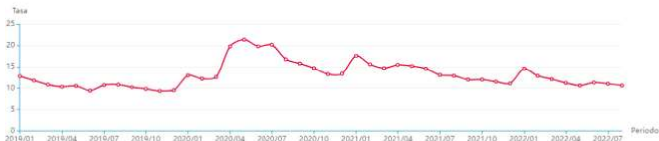
Tasa de desempleo Nacional, enero 2019 - agosto 2022